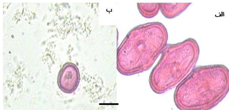
شکل ۳- رنگ آمیزی دانه گرده: الف) دانه گرده با اندازه طبیعی و رنگ پذیری کامل. ب) دانه گرده نابارور با اندازه کوچک (میکروگرده) (طول خط مقیاس برابر با ۱۰ میکرومتر است).