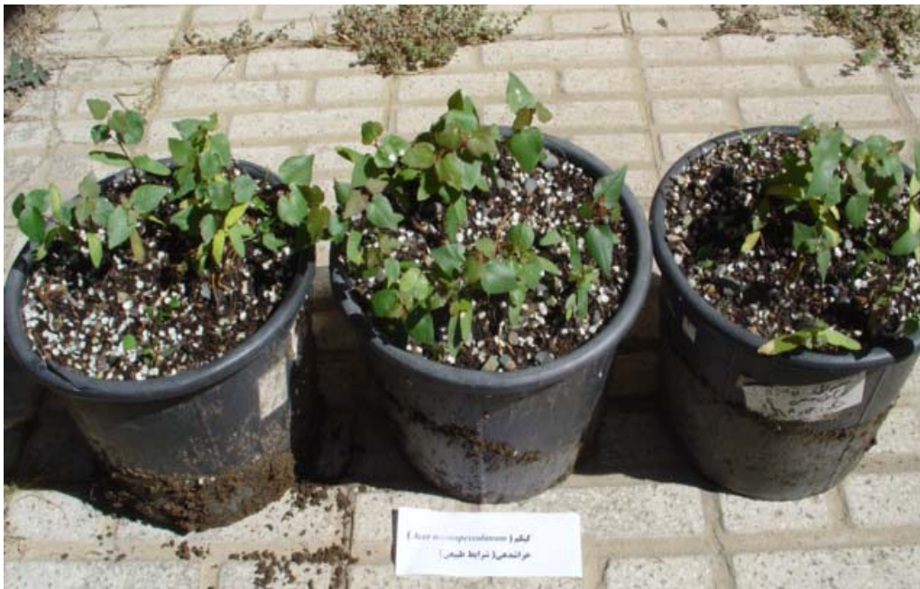
شکل ۴- جوانه‌زنی بذر کیکم و استقرار موفق گیاهچه‌ها، پس از خراش‌دهی و استفاده از بستر خاک مزرعه

همان طور که در جدول ۳ و شکل ۴ مشاهده می‌شود، با اعمال تیمار خراشده‌ی بذر کیکم و کاشت مستقیم در خاک مزرعه (نگهداری شده در شرایط طبیعی)، وضعیت