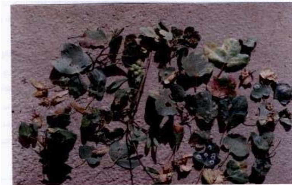
شکل ۱- آثار شدید حمله آفتها و بیماریها به درختان ضعیف (بر اثر خشک‌سالی) کیکم، در گردنه چری

ناشی از خشک‌سالیهای مداوم دهه ۷۰ باشد که موجب شده است. ضعف پایه‌های کیکم و به دنبال آن حمله آفتها و بیماریها