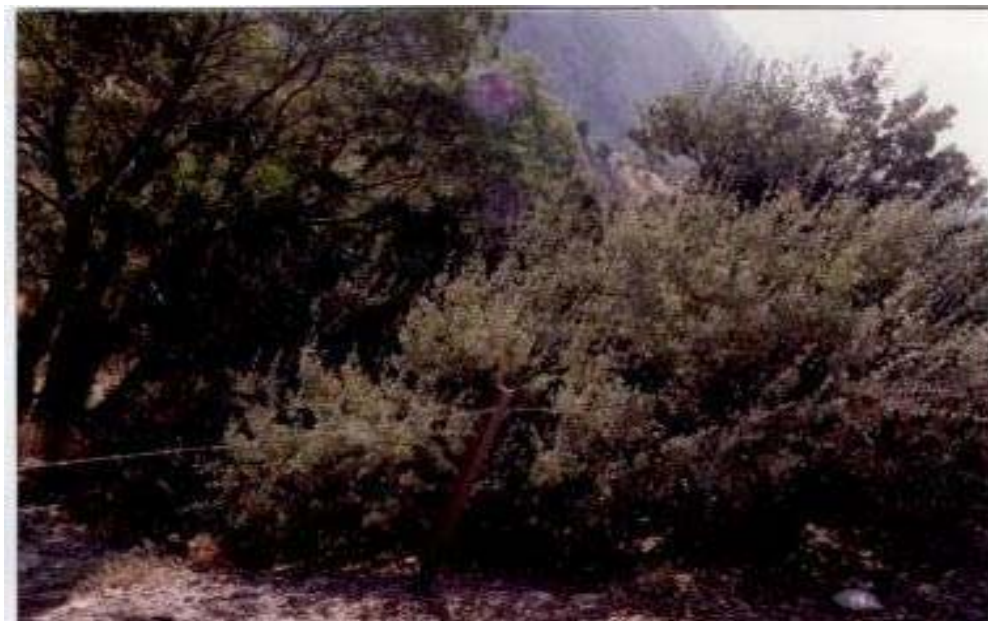
شکل ۲- دو پایه مطلوب کیکم در قرق چهارطاق اردل که از آنها بذر تهیه شد.

مرحله دوم، برداشت از پایه‌های موجود در قرق چهارطاق اردل و اطراف روستای فرخور در ارتفاع ۲۲۸۰ متر انجام شد (شکل ۲). خوشبختانه به رغم حمله شدید داروایش، این پایه‌ها مملو از بذر بودند.