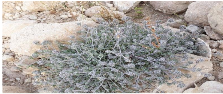
شکل ۱- گیاه مریم نخودی بلوچستانی در رویشگاه طبیعی دق‌فینو استان هرمزگان