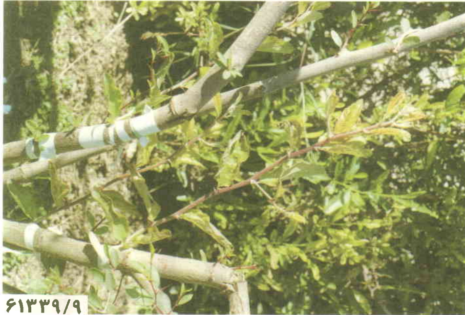
شکل شماره ۴: نمایش پیوند رقم بی‌هسته کنار در حال رشد

پیوندهای انجام شده پس از نگهداری و تیمار شروع به رشد نموده (شکل شماره ۴) و پس از گذشت چند ماه پیوندها به طور مطلوب رشد کرده و گیاهان تولیدی از نظر