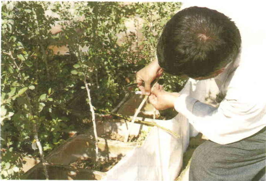
شکل شماره ۱: نحوه انجام عملیات پیوند شکمی در کنار

باید توجه داشت که در شرایط یکسان عملیات پیوند که در تمام ماهها مراعات گردیده است ماه اردیبهشت به دلیل گرمای زیاد منطقه کمترین میزان گرفتگی را نشان داده و در صورتی که محل پیوند در مقابل حرارت محیط و نور آفتاب محافظت گردد، احتمال افزایش میزان گرفتگی وجود خواهد داشت که البته نیاز به بررسی بیشتری دارد. در ضمن تاریخهای اوایل فروردین و نیز قبل از فروردین (اسفندماه) و بعد از آبان (آذرماه) نیز جهت آزمایش در نظر گرفته شده بود اما به دلیل عدم پوست‌دهی مناسب انجام عملیات کویوند شکمی میسر نشد. تاثیر فصل بر گرفتگی پیوند توسط Singhrot و همکاران (۱۹۸۰) روی گونه Z. mauritiana مورد بررسی قرار گرفت و نتیجه گرفتند که در ماه‌های ژوئن و ژوئیه با ۹۳/۱۵ درصد بیشترین و در ماه سپتامبر کمترین گرفتگی پیوند یعنی ۲۱/۱۶ درصد حاصل می‌شود.