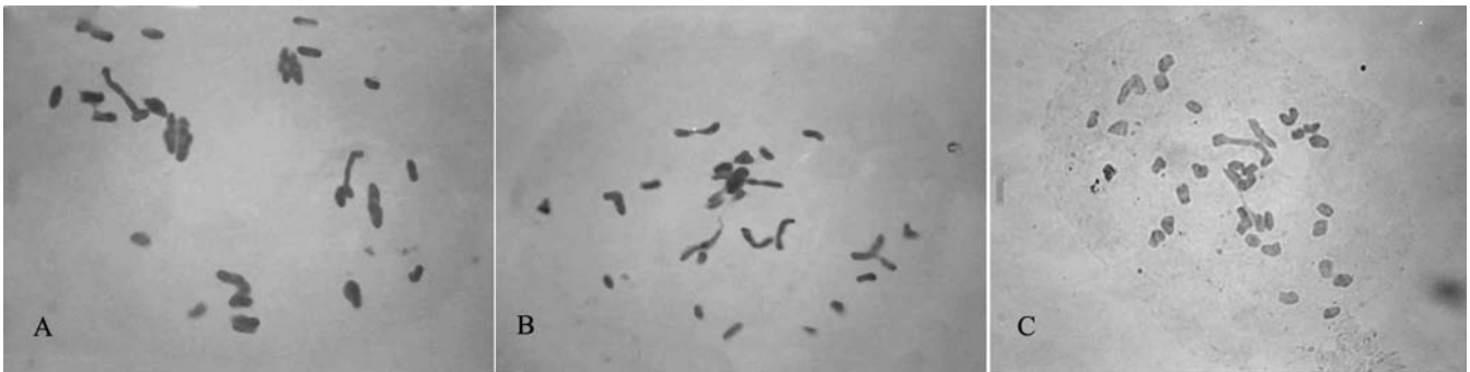
شکل ۳- نحوه جفت شدن کروموزومهای میوزی در نتاج هیبریدهای بین گونه‌ای در تلاقی T. aestivum/A. cylindrica

به ترتیب از A- دسته چهار ارومیه با ۲۱ یونیوالانت، ۱ بیوالانت میله‌ای و ۶ بیوالانت حلقوی B- دسته هشت خوی با ۲۳ یونیوالانت، ۶ بیوالانت میله‌ای C- دسته ۱۰ شیراز با ۲۹ یونیوالانت، ۲ بیوالانت میله‌ای و ۱ بیوالانت حلقوی