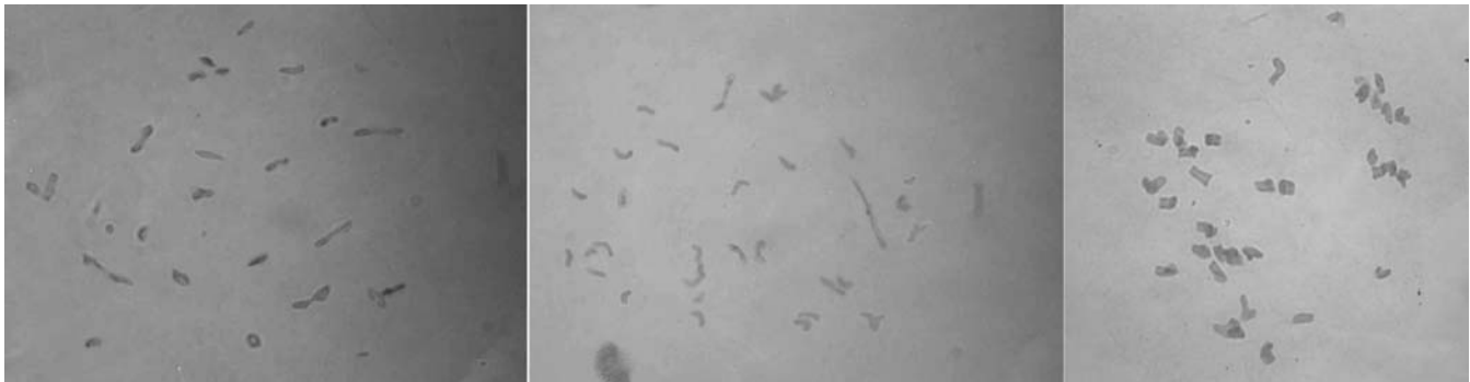
شکل ۴- نحوه جفت شدن کروموزومهای میوزی در نتاج هیبریدهای بین گونه‌ای در تلاقی T. aestivum/A. crassa به ترتیب از A- دسته ۱۲ مرند با ۲۱ یونیوالانت، ۴ بیوالانت میله‌ای و ۳ بیوالانت حلقوی B- دسته دو نفرش با ۳۱ یونیوالانت، ۲ بیوالانت میله‌ای C- دسته هفت شیراز با ۳۵ یونیوالانت

شیراز دیده شد. در این تلاقی تنها یک بیوالانت میله‌ای مشاهده گردید. در حالی که در نتایج تلاقی دیگری از همین دسته چهار بیوالانت میله‌ای مشاهده گردید، به نظر می‌رسد برای فراوانی جفت شدن کروموزومها در این دسته تنوع وجود دارد. با این حال وجود دو بیوالانت میله‌ای در هر سلول حالت عمومیت بیشتری داشته و در غالب نمونه‌ها مشاهده گردید.