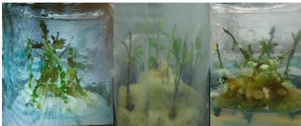
شکل ۲- محیط کشت‌های مختلف به منظور ریشه‌زایی الف) محیط MS ب) محیط پشم سنگ ج) محیط MS ۱/۲

تأثیر تیمارهای هورمونی بر ریشه‌زایی ۳ گونه زالزالک ( C. pseudohetrophylla , C. aronia , C. meyeri ) در هیچ‌یک از تیمارهای هورمونی و گونه‌ها ریشه‌زایی وجود نداشت، از این‌رو از تجزیه و تحلیل داده‌های مربوط به