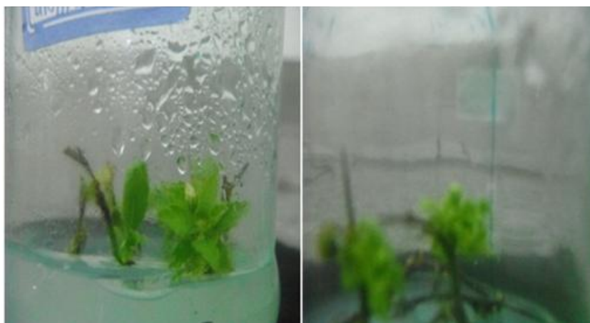
شکل ۳- گلدهی گونه C. aronia در محیط ریشه‌زایی حاوی ۱ میلی‌گرم در لیتر IBA