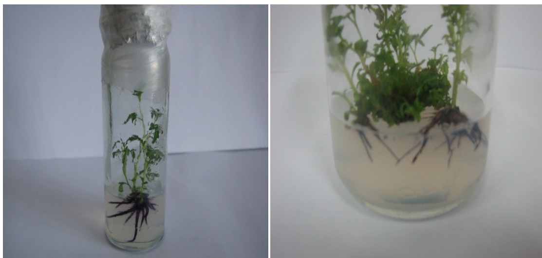
شکل ۲- ریشه‌زایی گیاه سماق

میانگین‌هایی که دارای حروف یکسان می‌باشند در سطح ۵٪ آزمون دانکن تفاوت معنی‌داری ندارند.