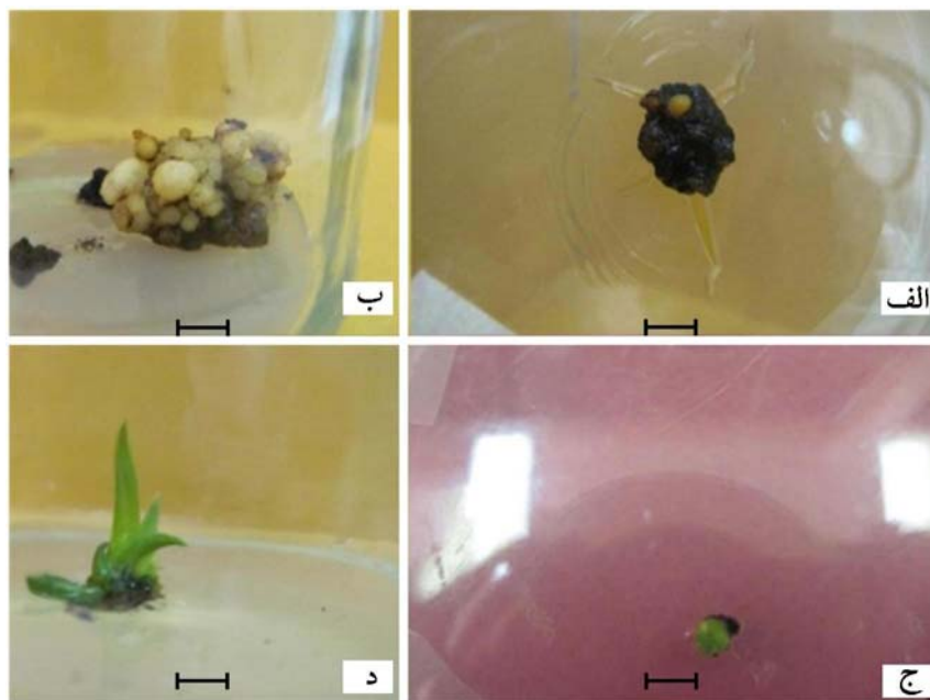
شکل ۲- مراحل جنین‌زایی رویشی غیرمستقیم، مقیاس ۱/۰-cm (الف) تشکیل جنین رویشی بر روی بافت کالوس، (ب) ازدیاد جنین‌زایی رویشی، (ج) بلوغ جنین به صورت تشکیل ساقه و (د) افزایش طول ساقه