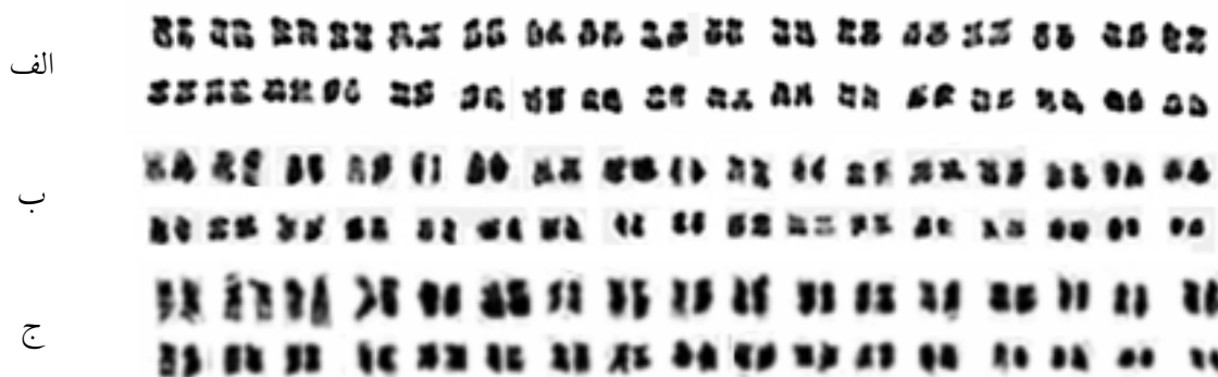
شکل ۲- کاریوگرام جمعیت‌های مورد مطالعه از گونه S. lavandulifolia Vahl (الف: سراب، ب) اردبیل و ج) مشکین شهر