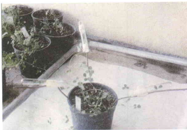
شکل شماره ۴- قرار گرفتن گل‌های تلقیح شده در لوله‌های آزمایش شیشه‌ای، بسته شدن دهانه لوله‌ها با استفاده از پنبه و تثبیت لوله‌های آزمایشی روی پایه‌های میله‌ای به مدت ۱۵ تا ۱۷ روز.