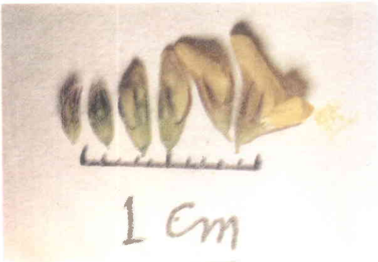
شکل شماره ۲: گل در یونجه یکساله ( M. polymorpha )، در مراحل متفاوتی از رسیدگی. در دو گل سمت چپ کیسه‌های گرده هنوز به طور کامل نرسیده و دانه گرده در آنها قادر به تلقیح مادگی گل نیستند. از این رو گل در یونجه‌های یکساله در این مرحله، مناسب برداشتن کیسه گرده می‌باشد.