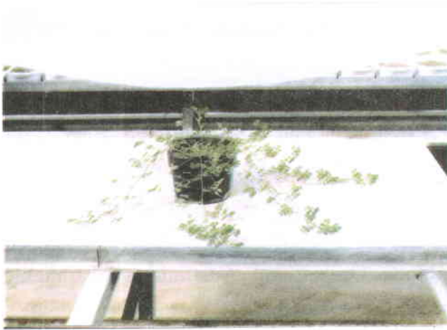
شکل شماره ۱- وضعیت عمومی بوته مورد استفاده در انجام مراحل برداشتن کیسه گرده از داخل گل