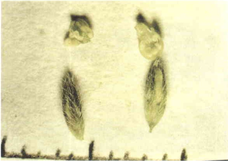
شکل شماره ۵- کیسه‌های گرده و مادگی گل در یونجه یکساله M. polymorpha در زمان مناسب جهت برداشتن کیسه گرده و اخته کردن گل‌های پایه مادری در تلاقیهای بین و درون گونه ای.