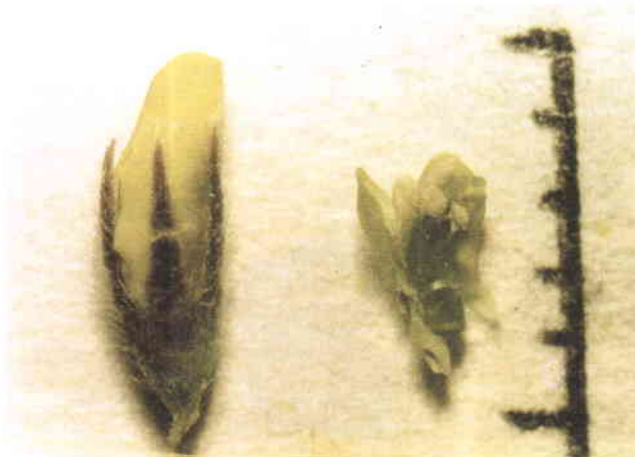
شکل شماره ۶: گل یونجه یکساله M. rigidula در مرحله‌ای که گلبرگها به اندازه‌ای رشد نموده‌اند که از انتهای دندان‌های کاسبرگها خارج شده‌اند. در این مرحله کیسه‌های گرده به طور کامل رسیده و دانه‌های گرده قادر به تلقیح مادگی گل هستند.