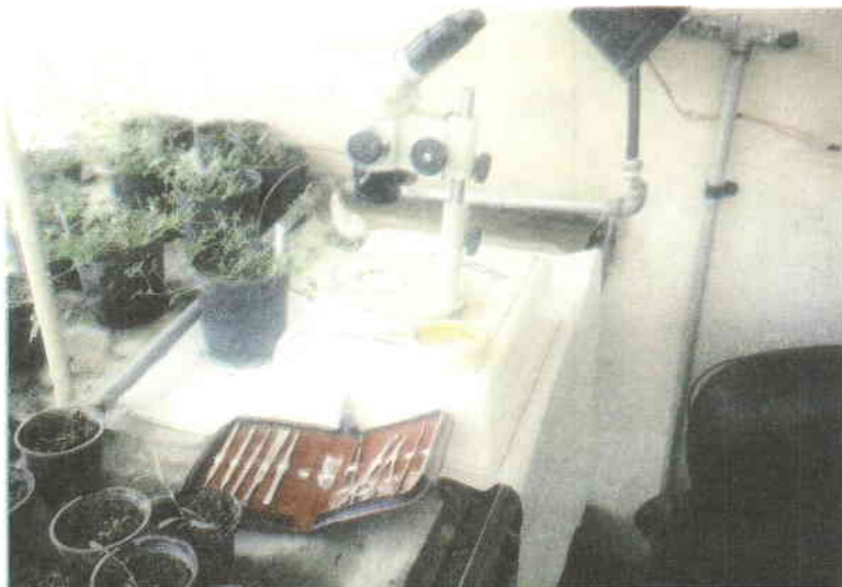
شکل شماره ۳- استفاده از بینوکولار جهت مشاهده اندامهای مختلف گل در یونجه یکساله و برداشتن کیسه‌های گرده