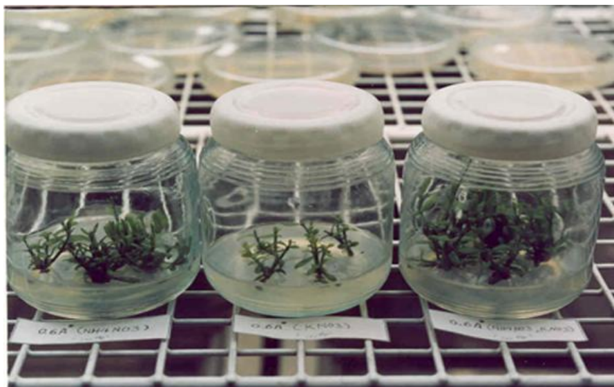
شکل شماره ۱- مقایسه شاخساره‌های کشت شده در تیمارهای مختلف ازت‌دار (از چپ به راست N1, N2, N3) با غلظت MS ۰/۶ (۴۵ روز پس از کشت)